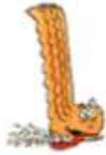
la l imace