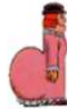
la d ame

Mon doigt montre le fond de ma bouche et je dis « c ».