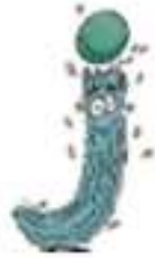
le j et d'eau