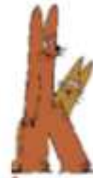
le k angourou

Je fais un petit point sur ma joue et je dis « j ».