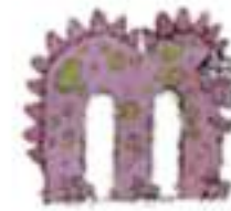
le m onstre

Je mets mon doigt devant mes lèvres et je dis « l » avec ma langue.