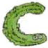
le c ornichon