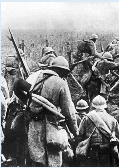
Doc 1 : Bataille de Verdun

Les tensions en Europe rendent la guerre inévitable. Elle éclate au mois d'Août 1914 et oppose d'un côté la France et ses alliés la Russie et le Royaume-Uni et de l'autre l'Allemagne et l'Autriche-Hongrie. Les troupes allemandes envahissent rapidement la Belgique et le Nord de la France et menacent même Paris. Les troupes françaises contre attaquent et à la fin de l'année 1914, le front des combats est stabilisé : on s'achemine vers une guerre de tranchées . Les soldats, pendant quatre ans vivent abrités dans des tranchées et des abris enterrés, sans hygiène, dans la boue et meurent par centaines de milliers sous les tirs d'obus ennemis. Grâce aux Etats-Unis , La France et ses alliés gagnent la Guerre en novembre 1918 . La France retrouve l'Alsace et la Lorraine et l'Allemagne doit payer des réparations mais l'Europe compte dans ce conflit plus de 9 millions de morts et deux fois plus de blessés. L'Europe se retrouve ruinée , elle ne domine plus le Monde. En Allemagne le parti Nazi établit une dictature et prépare la conquête de l'Europe.