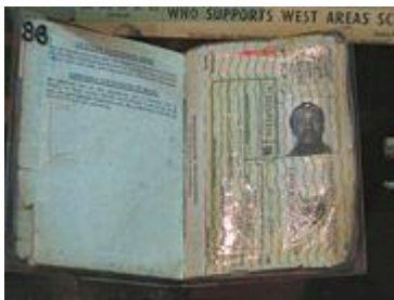
Un passeport pour Noirs du temps de l'apartheid

Pendant l'apartheid, un enfant noir vit dans un quartier réservé aux noirs un bus réservé aux noirs. Pourtant à cette époque les noirs sont plus nombreux que les blancs.