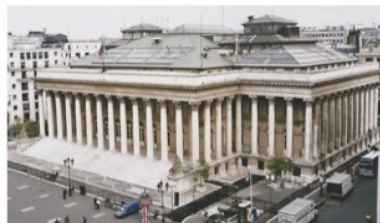
Bourse de Paris