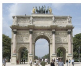
Arc de triomphe du carroussel