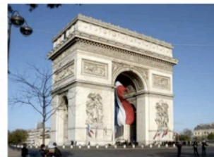
Arc de triomphe de l'étoile