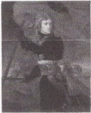
Napoléon lors de la bataille d'Arcole en Italie. Toile d'Antoine-Jean Gros