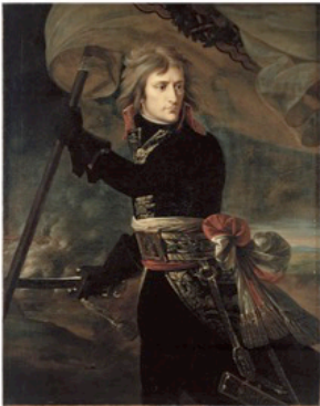
Napoléon lors de la bataille d'Arcole en Italie. Toile d'Antoine-Jean Gros