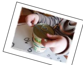
Placer des élastiques autour d'un objet