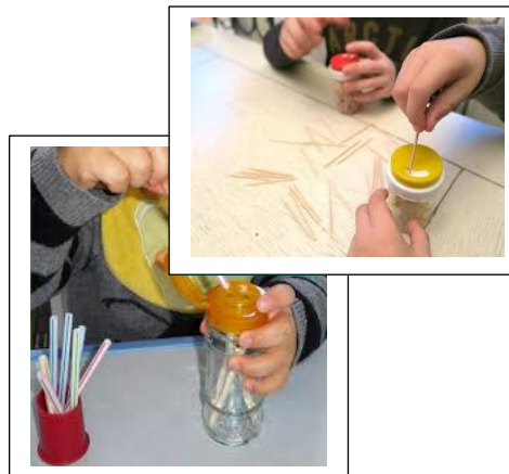
Insérer des petits objets : pailles, cure-dents dans une boîte