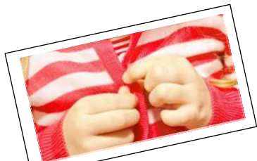
Boutonner son vêtement

Voici aussi d'autres activités qui y contribuent :