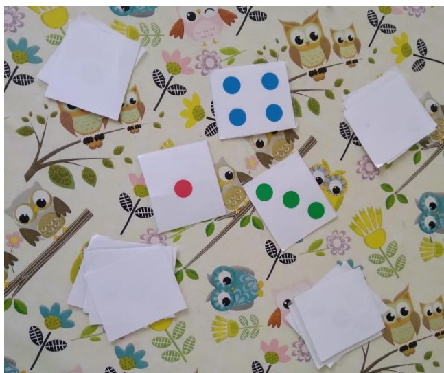
là, c'est 4 et 1