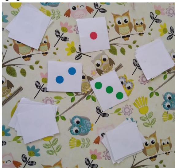
Ici, c'est 2 et 3

Les enfants ont posé chacun leur tour une carte, le premier qui trouve 5 avec 2 cartes a gagné ces cartes.