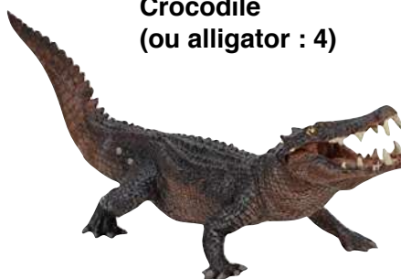
Crocodile (ou alligator : 4)