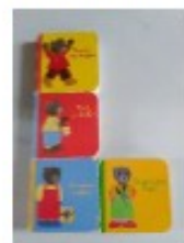
avec des livres