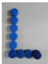
avec des bouchons