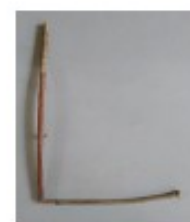
avec des bâtons