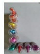
avec des tampons encreurs