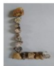
avec des cailloux