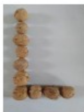
avec des noix