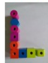
avec des perles