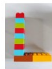
avec des cubes emboîtables