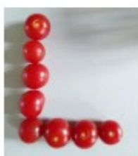
avec des tomates