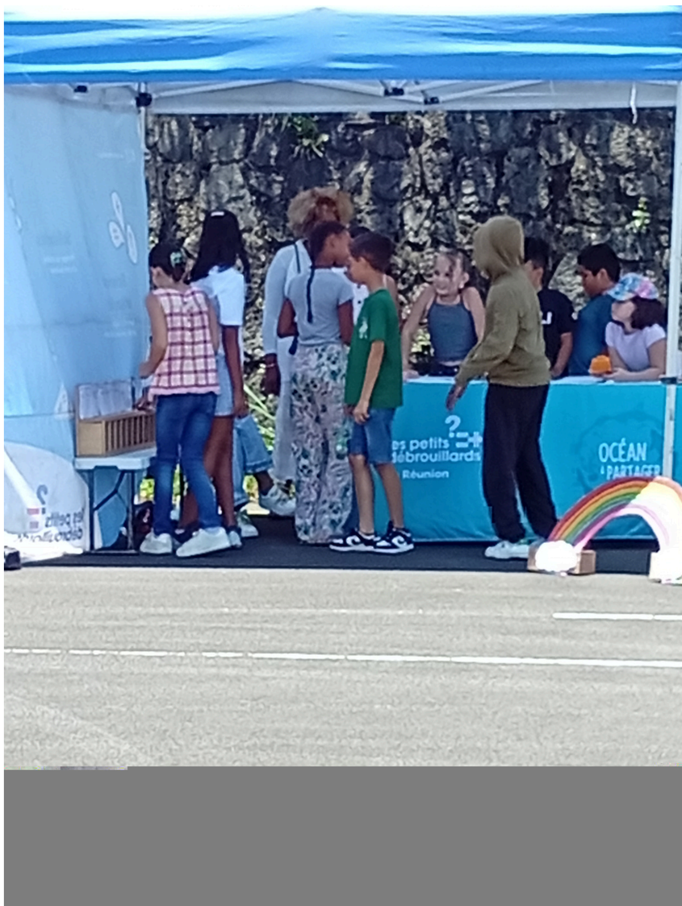
ÉQUIPE DU QUESTIONNAIRE