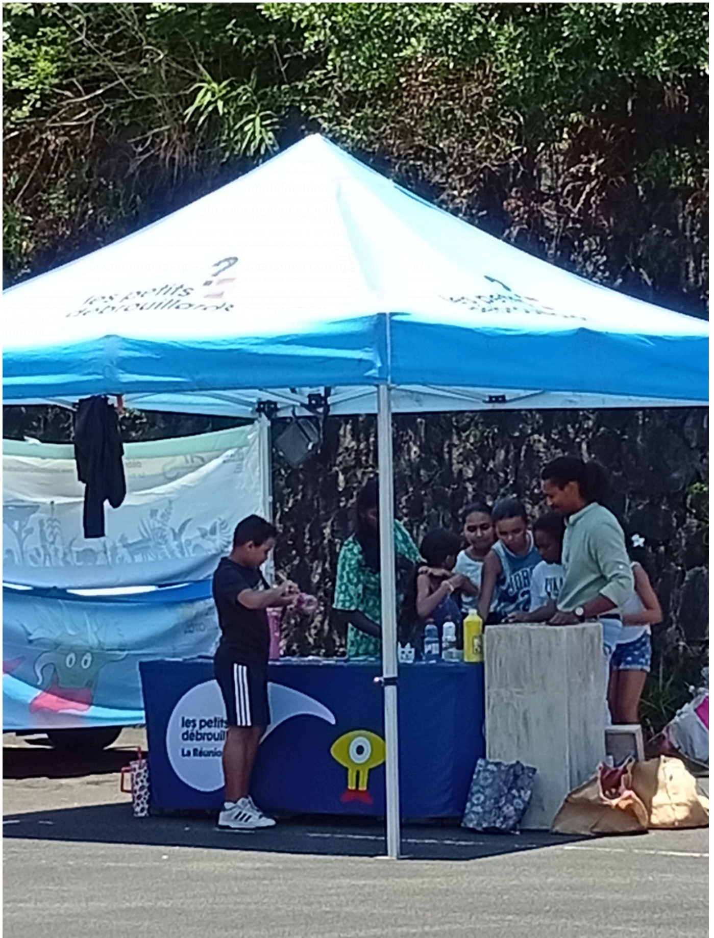
ÉQUIPE DU RECYCLAGE DE BOUTEILLES