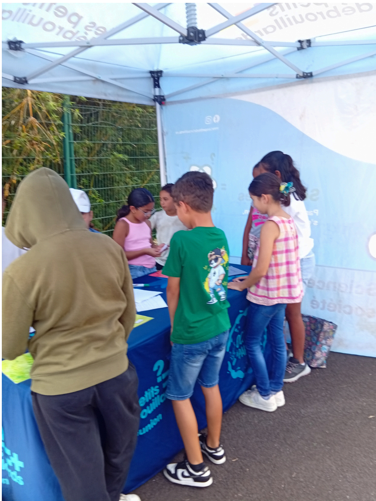
ÉQUIPE DU JEU