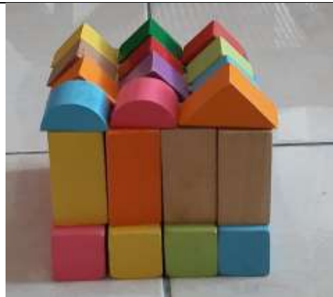
Défi relevé par une élève du groupe orange