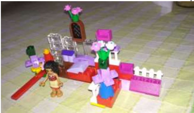
Défi réalisé par une élève du groupe bleu