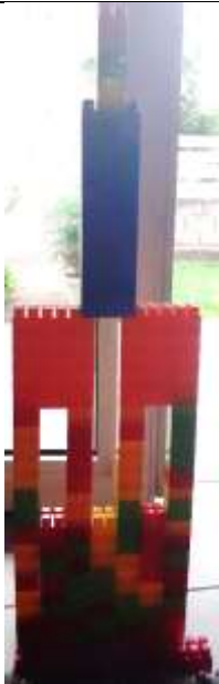
Une très haute tour réalisée par un élève du groupe jaune.