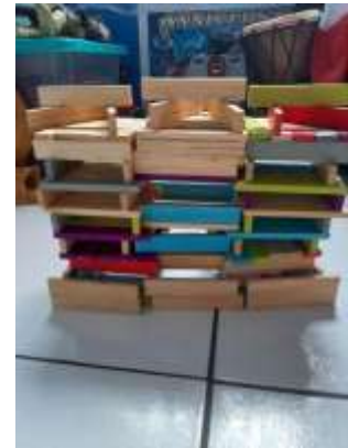
Défi relevé par un élève du groupe orange