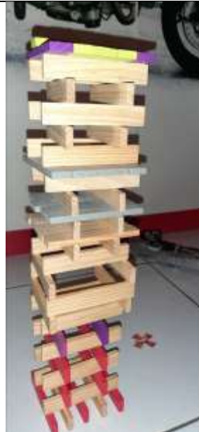
Une autre très haute tour réalisée par un élève du groupe orange.