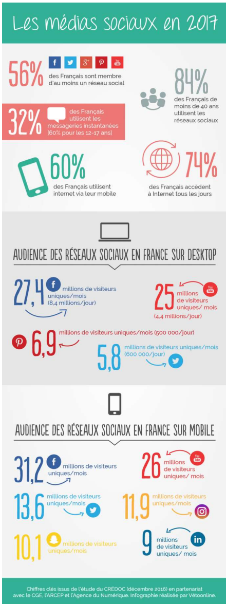
Doc3 - Les médias sociaux en France

Quels sont les réseaux sociaux les plus utilisés dans le monde ? En France ?