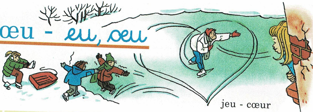
jeu - cœur