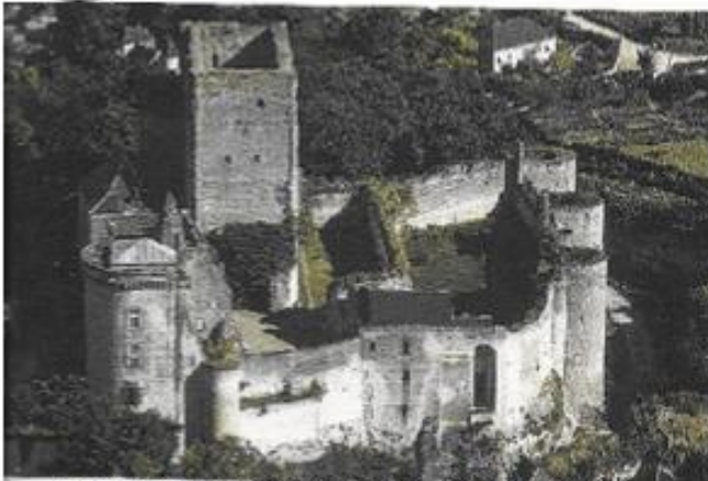
Château de Loches (construit entre 1013 et 1035) Château du Moyen Age.