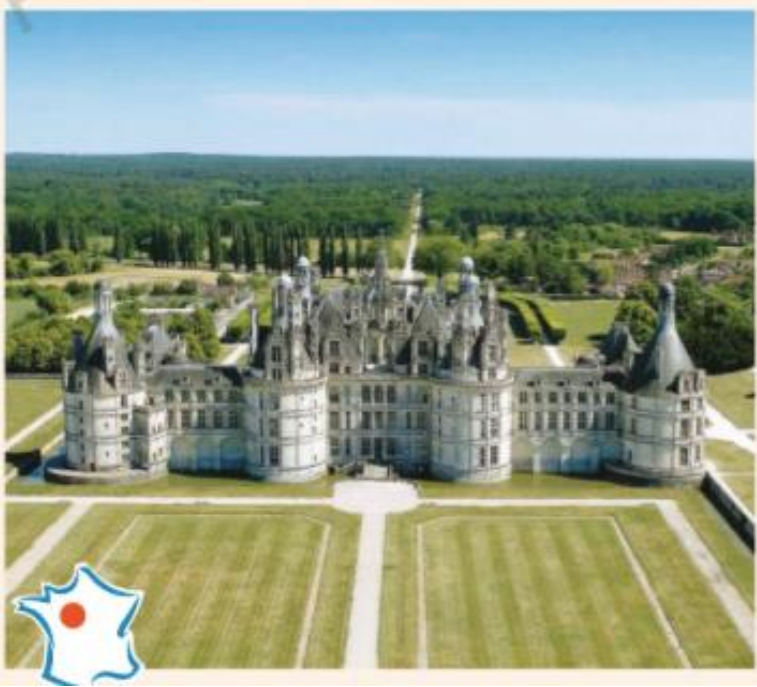
Château de Chambord XVIème siècle