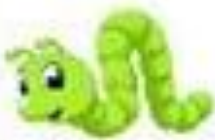
Un ver vert

Il s'agit d'un mot qui a la même prononciation qu'un autre, mais qui ne signifie pas la même chose.