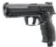
un révolver/ pistolet