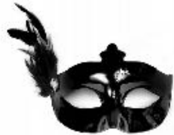
un loup de carnaval