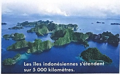
Les îles indonésiennes s'étendent sur 5 000 kilomètres.

Certaines régions sont essentiellement formées d'îles, parsemées dans l'océan. L'Indonésie en est un exemple. Elle se compose de plus de 13 700 îles disséminées sur une vaste étendue.