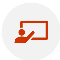
Tableau : Exemple

http://www.cartablecps.org/docs/Fichier/2016/7-160701044329.pdf