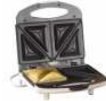
un appareil à croque-monsieur