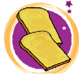
pain de mie