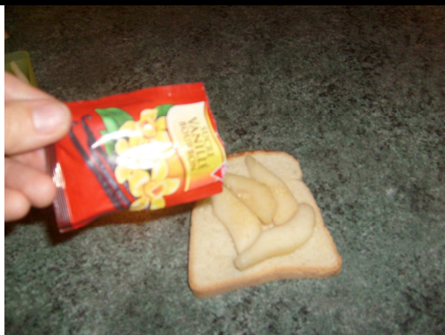
3. Saupoudre de sucre vanillé.