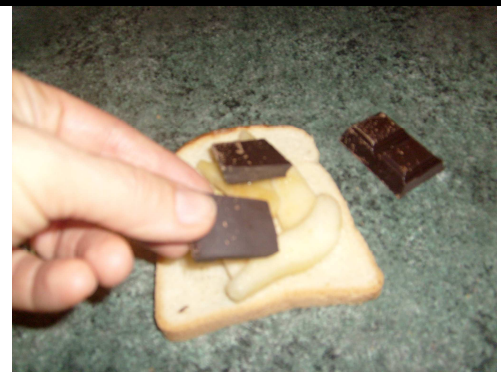
4. Ajoute 3 carrés de chocolat.