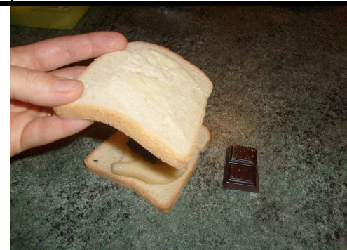
5. Recouvre de la deuxième tranche.