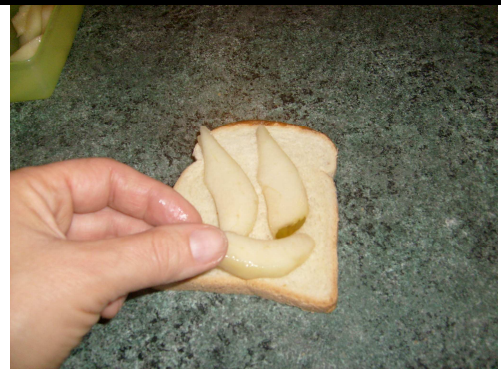
2. Pose des fines tranches de poire.