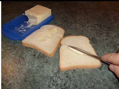
1. Beurre le pain de mie.