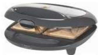
6. Fais cuire 4 minutes.