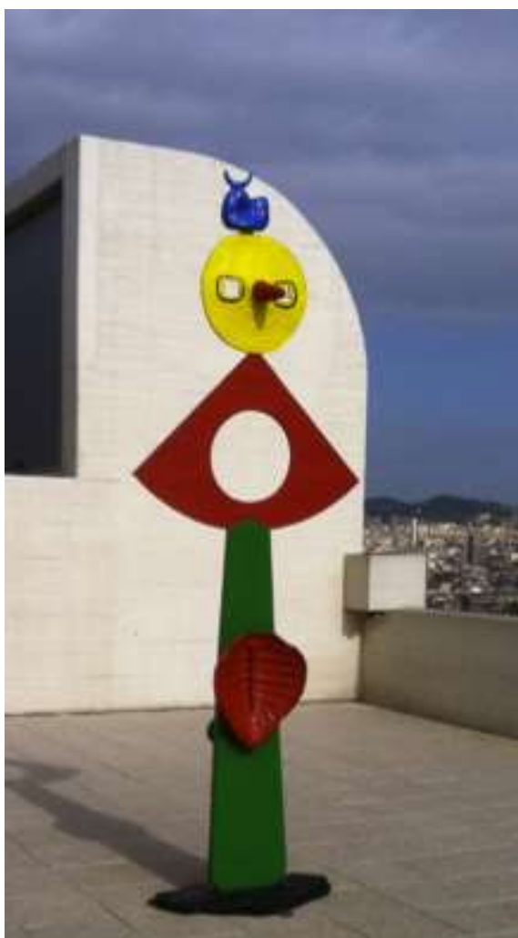
La Caresse d'un oiseau de Joan Miró 1967

Dans les tableaux de Miro, on voit danser des formes, des signes et des personnages aux formes étranges et de couleurs vives.