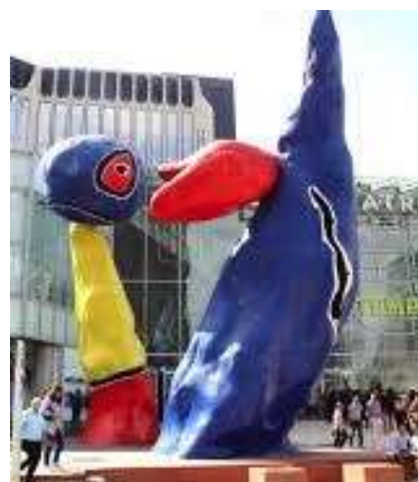
Deux personnages fantastiques de Joan Miró 1976