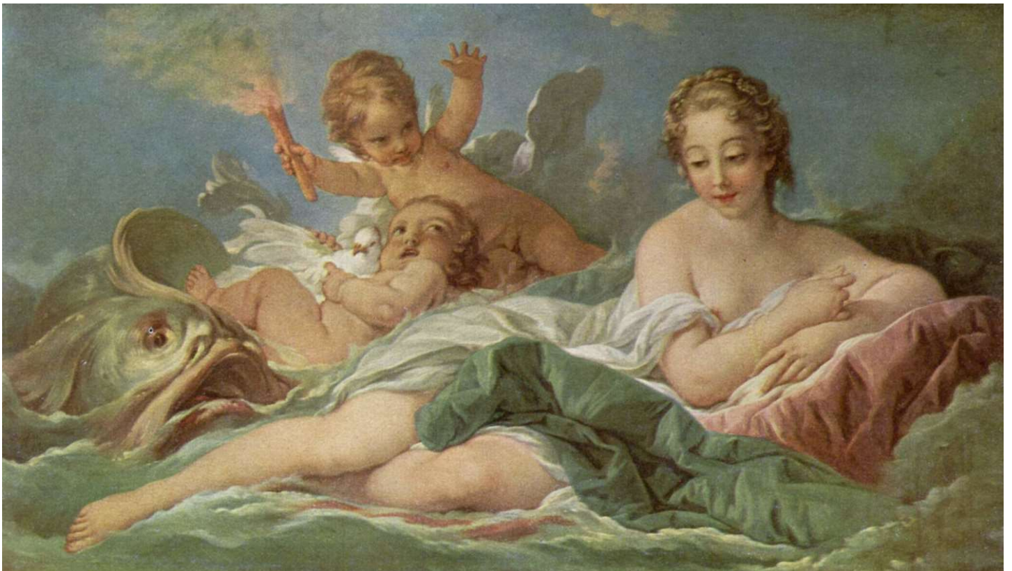
François Boucher- la naissance de Vénus, 1754, peinture, style rococo