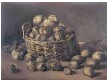
Nature morte avec un panier de pommes de terre 1885 Vincent Van Gogh