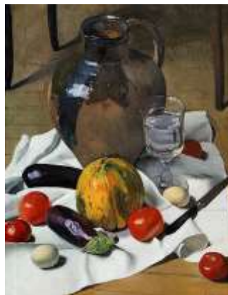
Félix Vallotton, 1923 - Nature morte avec cruche en terre cuite

Une nature morte est un genre artistique qui représenté généralement sous forme de peinture ou photographie représentant des objets (comme des fruits, des fleurs, des vases, des objets inanimés, etc.) ou des êtres inanimés.