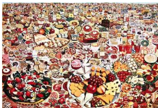
ERRO (1932), Foodscape, 1962-64, huile sur toile, 200x300 cm, Stockholm

Plusieurs artistes témoignent de la société actuelle, de la consommation excessive.