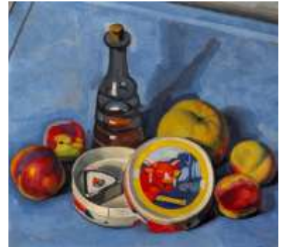
Nature morte à la Vache qui rit de Marcel-Lenoir