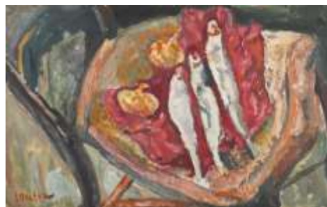
Nature Morte aux Harengs et aux Oignons Chaïm Soutine 1917