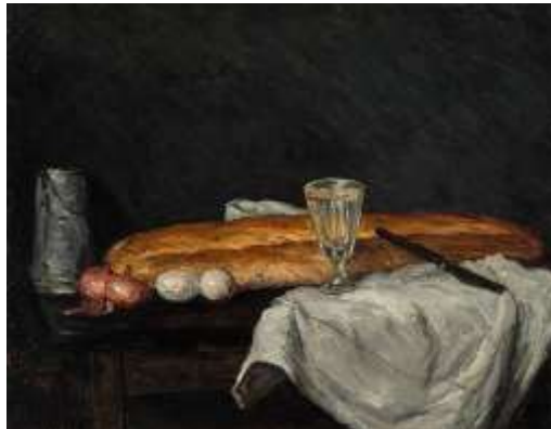
Le pain et les œufs, par Paul Cézanne 1865