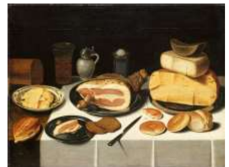
Nature morte au jambon par Van Schooten

Le sais-tu ? Le hors-d'œuvre correspond, dans le repas occidental classique, au second plat (après le potage). Il s'agit le plus souvent de mets délicats servis en petites pièces.