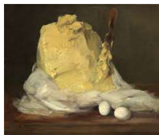
Motte de beurre de Vallotton