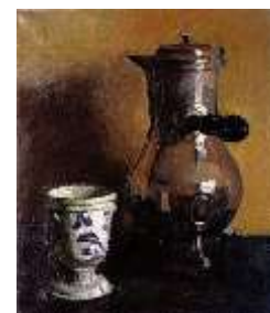
Albert Marquet La Cafetière 1902 (Musée des arts de Bordeaux)