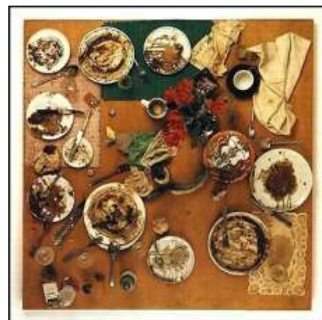
SPOERRI Daniel (1930), Tableau-piège, 1965, Zurich, vaisselle et repas sur table