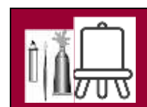
MATÉRIAU Peinture à huile sur carton