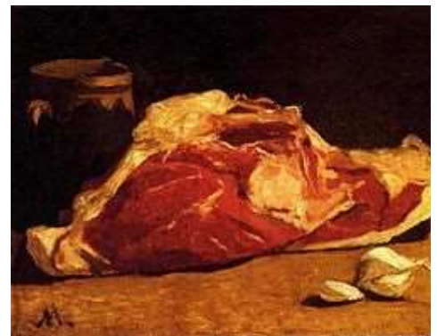
Nature morte à la viande 1864 Claude Monet