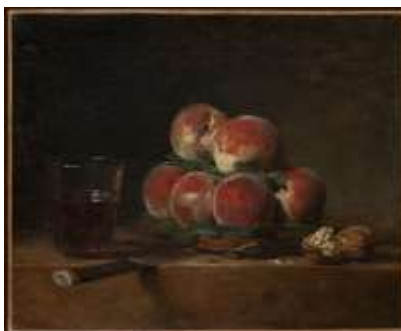
Panier de pêches par Jean Baptiste Siméon Chardin