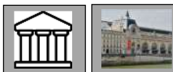
LOCALISATION DE L'ŒUVRE