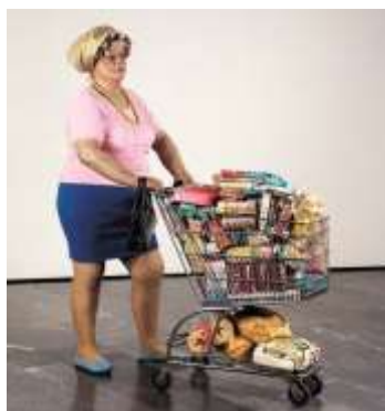
Hanson- Supermarket Lady 1969