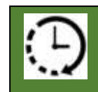
DATE DE CREATION

Vallotton, Félix (1865 – 1925) « Le dîner, effet de lampe » 1899 huile sur carton marouflé sur bois H. 58,0 ; L. 90,0 cm musée d'Orsay, Paris, France