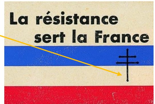
La croix de la Résistance

Mais, certains Français refusent de baisser les bras et décident de résister.