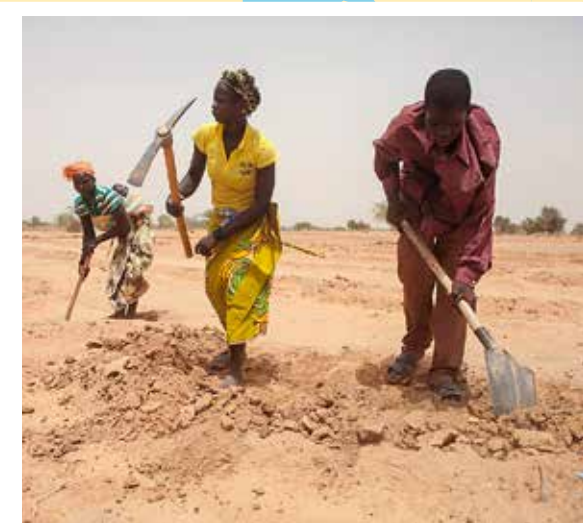
Des habitants du Burkina Faso creusent la terre pour faire des plantations.