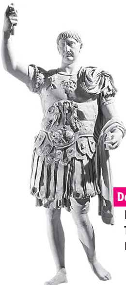
Doc. 2 L'empereur Trajan, 1 er siècle.