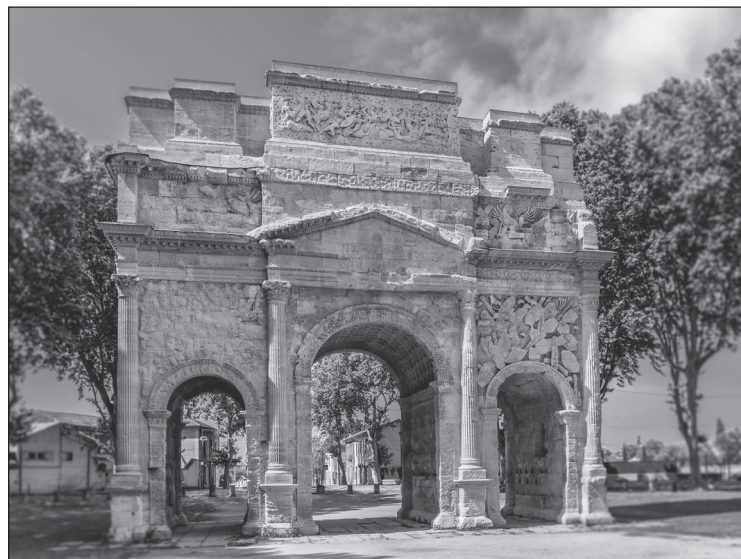
Doc. 3 L'arc de triomphe d'Orange, 1 er siècle. Les arcs de triomphe étaient construits pour célébrer les victoires militaires des empereurs romains ou des moments importants de leur règne.

5. À quoi voit-on que les empereurs romains étaient importants ?