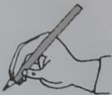
mauvais placement du majeur