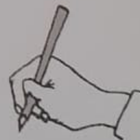
mauvaise position du pouce