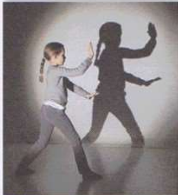
DOC. 1 Une petite fille et son ombre