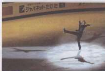
DOC. 2 Un patineur (Patrick Chan) et ses ombres

Il y a plusieurs ombre car il y a plusieurs sources de lumières : plusieurs projecteurs placés à des endroits différents.