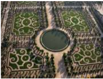
Les jardins du château de Versailles