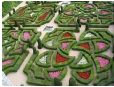
Les jardins de Chenonceau