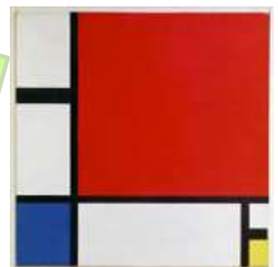
Composition II en rouge, bleu et jaune 1930

L'art abstrait est un art qui ne représente pas la réalité.