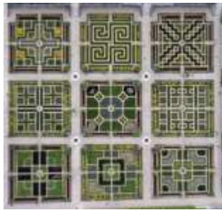
Les jardins de Villandry