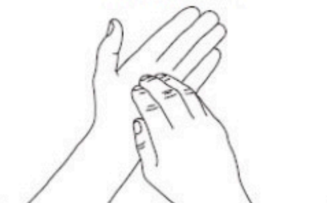
6 Ongles Désinfection des ongles