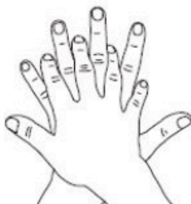
2 Paume sur dos Désinfection des doigts et des espaces interdigitaux