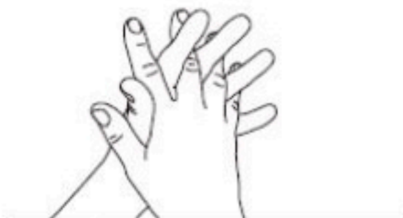
3 Doigts entrelacés Désinfection des espaces interdigitaux et des doigts