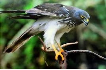
Le Papangue (Pied jaune)

Après le paille-en-queue, découvre le papangue .