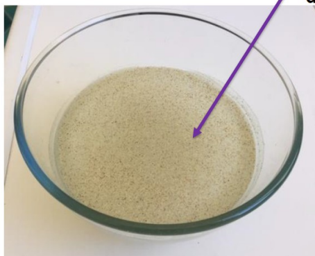
1 saladier contenant de l'eau dont la surface est couverte de poivre

Mets ton doigt dans l'eau, et ressorts-le. Il est couvert de grains de poivre. Comment faire pour que ton doigt reste propre en ressortant de l'eau?