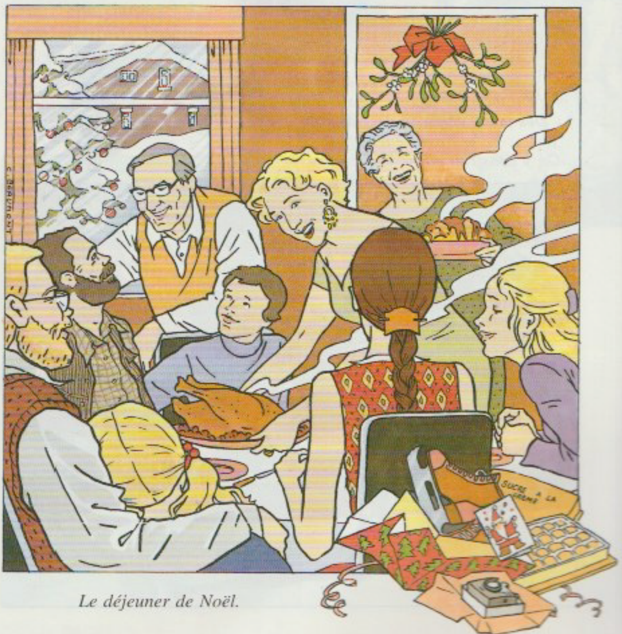
Le déjeuner de Noël.

Le repas est délicieux. Maman a fait une dinde aux « atocas ». Ce sont de petites baies rouges, un peu amères, que l'on prépare dans une gelée sucrée. Bien sûr, Pierre préfère la bûche au chocolat ! Après le repas, son père propose d'aller pêcher sous la glace, au lac Taureau. « Bonne idée, s'exclame Pierre, j'emporte mes cadeaux ! »