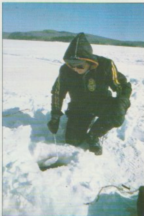
Pêche à la ligne sur le lac gelé.