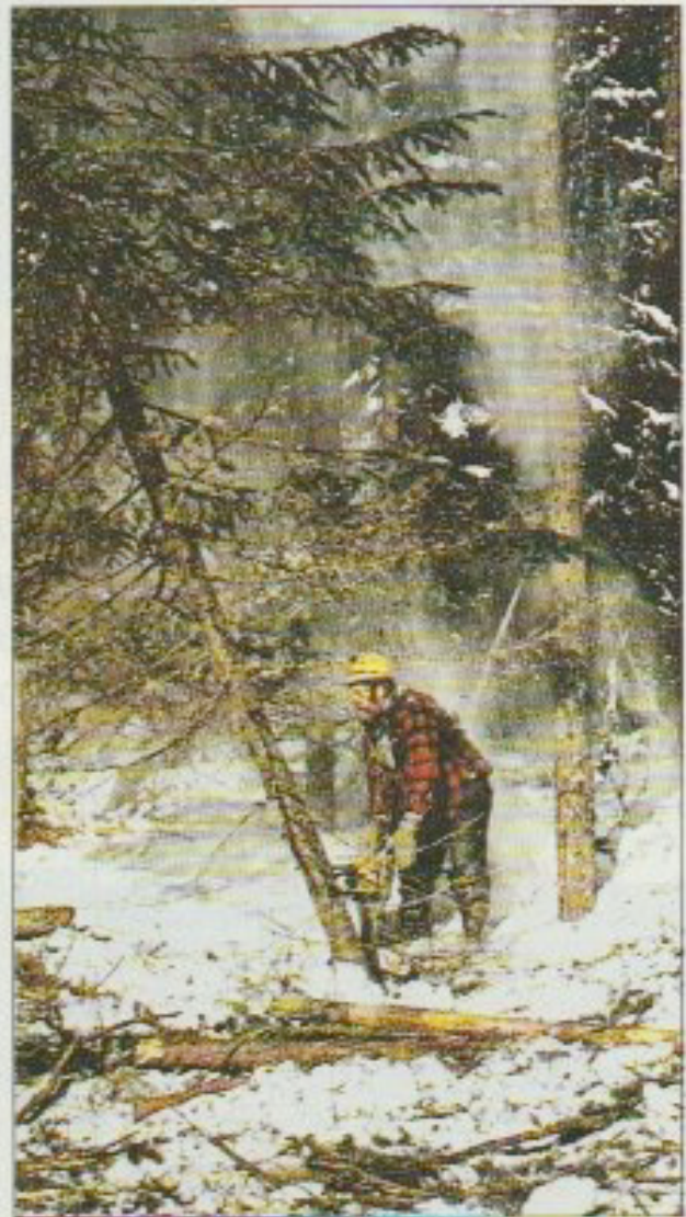
Bûcheron au travail dans la neige et le froid.

La veille de Noël, il est tout excité. «Et ce soir, dit-il 15 d'un air complice, pas de feu dans la cheminée! Sinon, le Père Noël ne pourrait pas venir!» À sept ans, on aime encore les belles histoires... 20 Avant d'aller se coucher, il accroche une grande chaus- sette de laine à la cheminée. Puis, à côté, il pose un verre de lait et une assiette de bis- 25 cuits. Cette nuit-là, il a bien du mal à s'endormir!