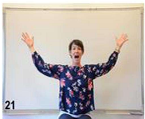
21- on commence à refermer les bras