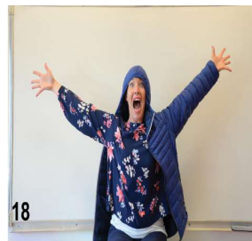
18- on enlève le bras droit