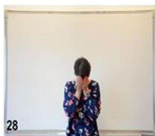
28- on arrondi le haut des épaules