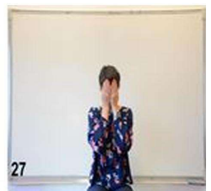
27- on plie le cou