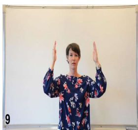
9-yeux ouverts on ouvre les mains