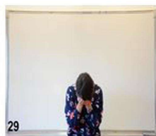
29- on arrondi jusqu'au milieu du dos