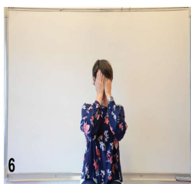
6- on est bien droit mains sur les yeux