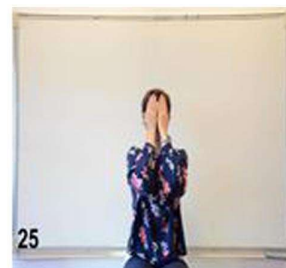
25- mains sur les yeux fermés