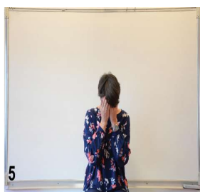
5- On se redresse encore un peu mains sur les yeux