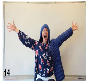
14- on enfle le bras gauche