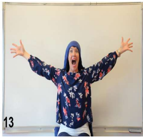
13- on enfle la capuche expression ouverture maximale