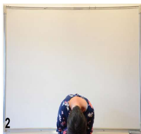
2-on se redresse un peu mains sur les yeux