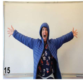
15- on enfle le bras droit