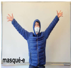
17- on enfle un masque