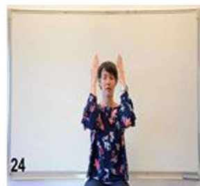
24- yeux fermés, on continue à refermer les bras