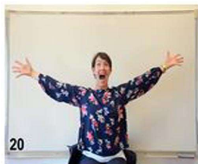
20- on enlève la capuche