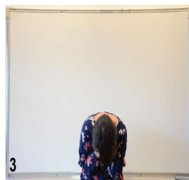
3, 4 on se redresse un peu plus à chaque fois