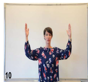
10- on ouvre l'expression de plus en plus