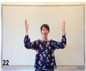
22-23- on continue à refermer les bras