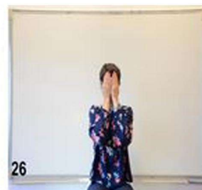
26- on commence à se replier, on incline la tête