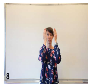
8- on ouvre les yeux