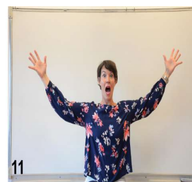
11,12- on ouvre au maximum les bras / la bouche et les yeux