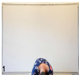
1- buste allongé sur les genoux mains sur les yeux