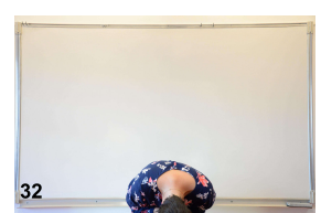
32- position de départ buste complètement allongé sur les cuisses mains sur les yeux