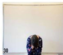
30- on est baissé aux 3/4