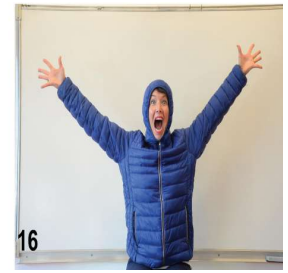
16- on remonte la fermeture éclair ou les boutons jusqu'en haut