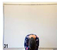
31- dos arrondis les mains commencent à toucher les genoux