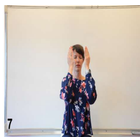
7- on ouvre les mains yeux fermés