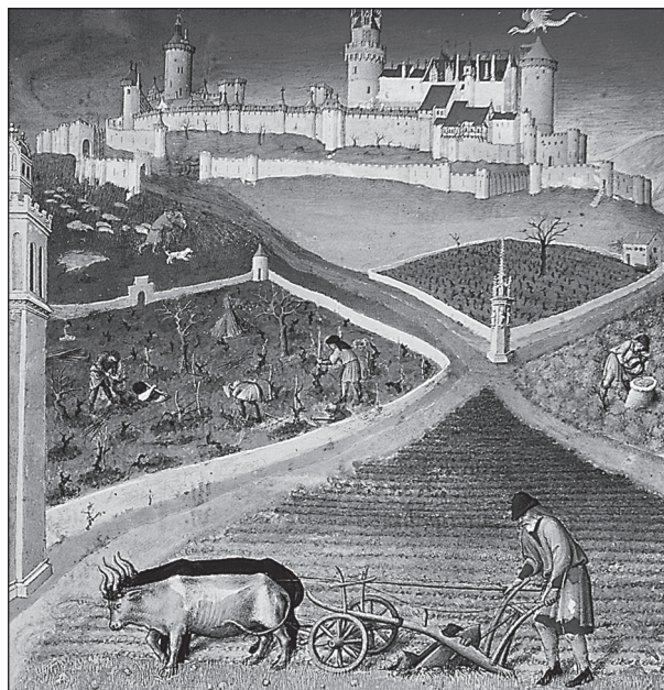
Doc. 1 Les Très Riches Heures du Duc de Berry, « Le Mois de mars », XIV e siècle.