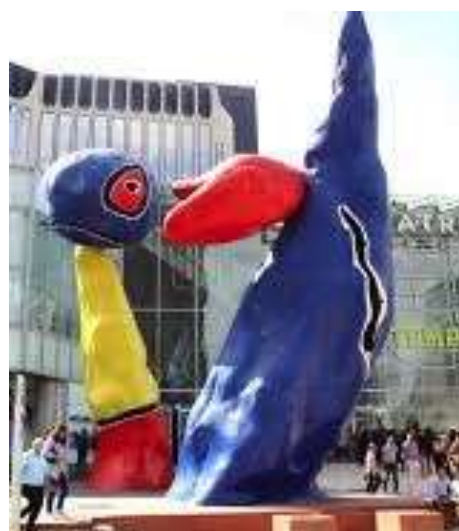
Deux personnages fantastiques de Joan Miró 1976