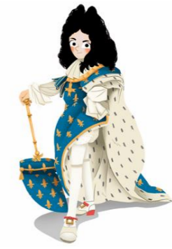
Louis XIV 1643 - 1715

1150 1200 1250 1300 1350 1400 1450 1500 1550 1600 1650 1700