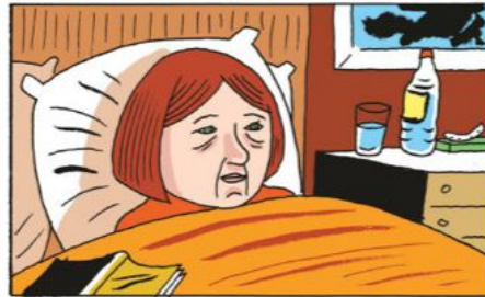
Mamie est malade.

Etape 1 : Observe ces deux phrases et les dessins associés