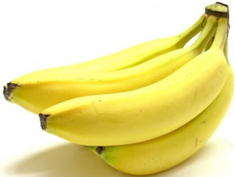
BANANE banane banane