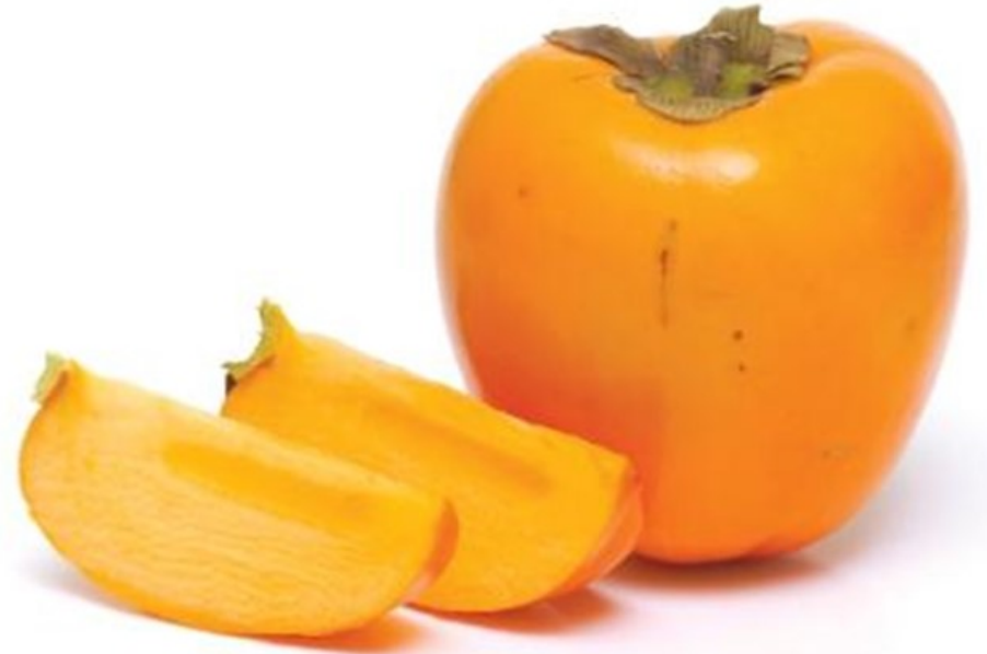
KAKI kaki kaki