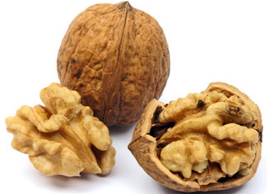
NOIX noix noix