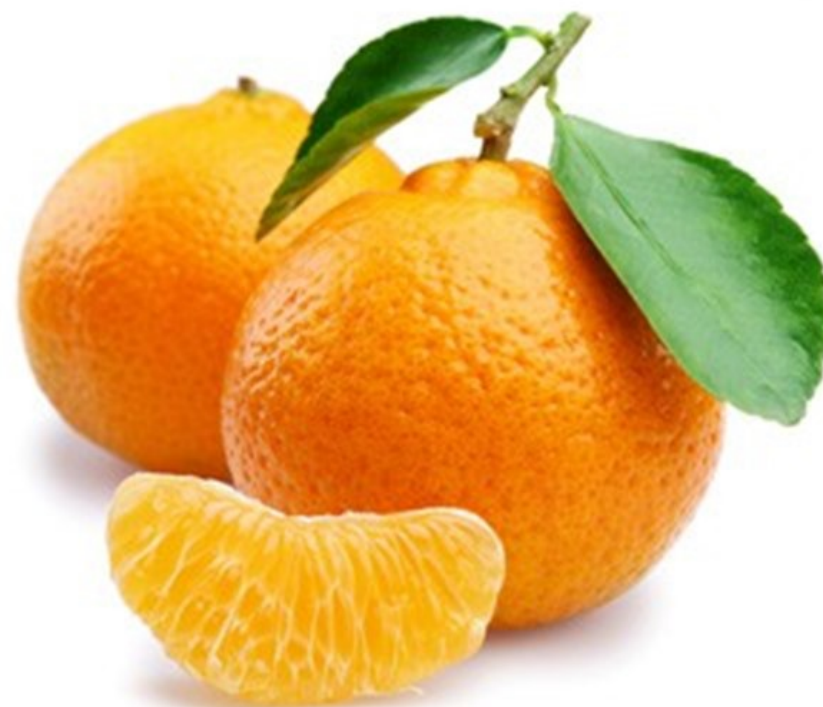
CLEMENTINE clémentine clémentine