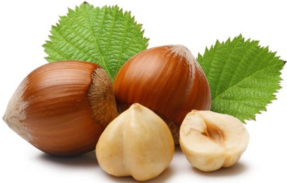
NOISETTE noisette noisette