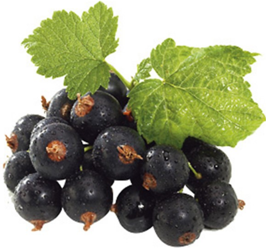
CASSIS cassis cassis