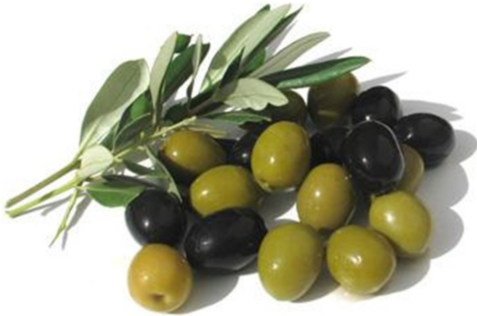
OLIVE olive olive