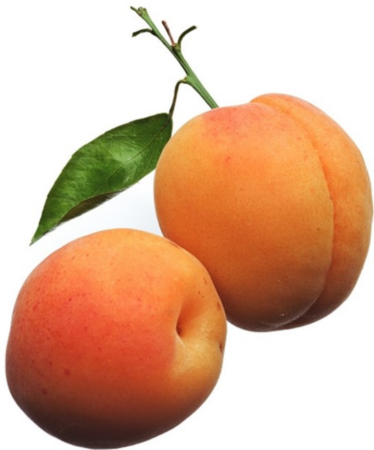
ABRICOT abricot abricot