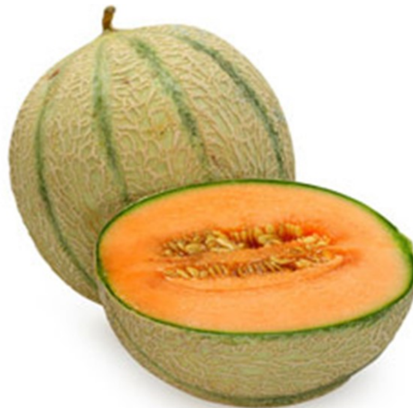
MELON melon melon