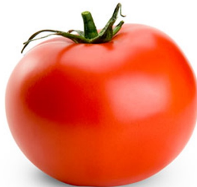
TOMATE tomate tomate