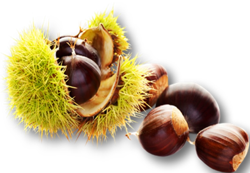
CHATAIGNE châtaigne châtaigne