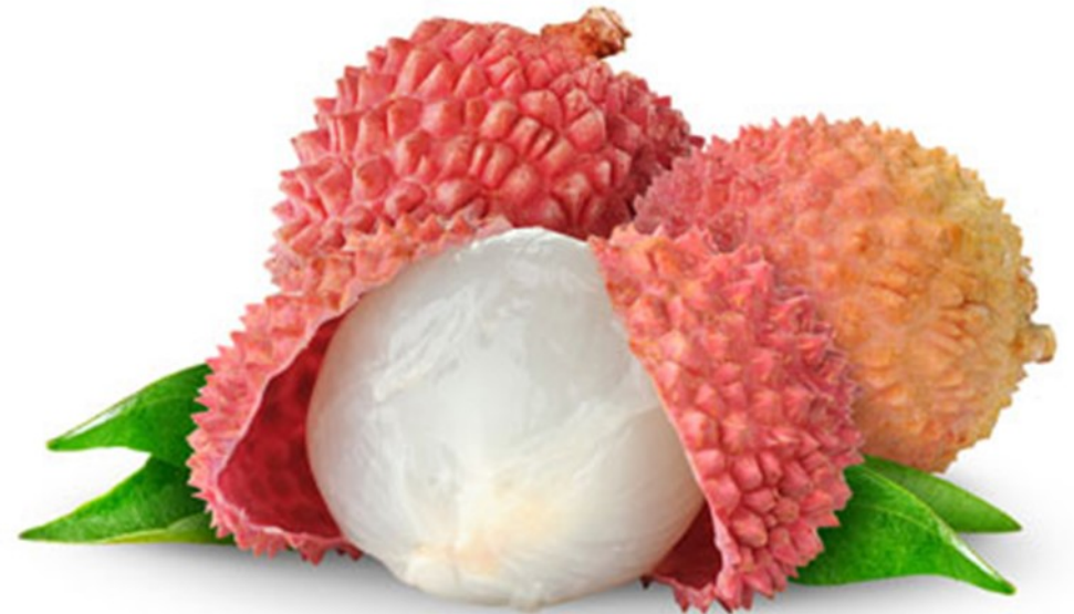
LITCHI litchi litchi