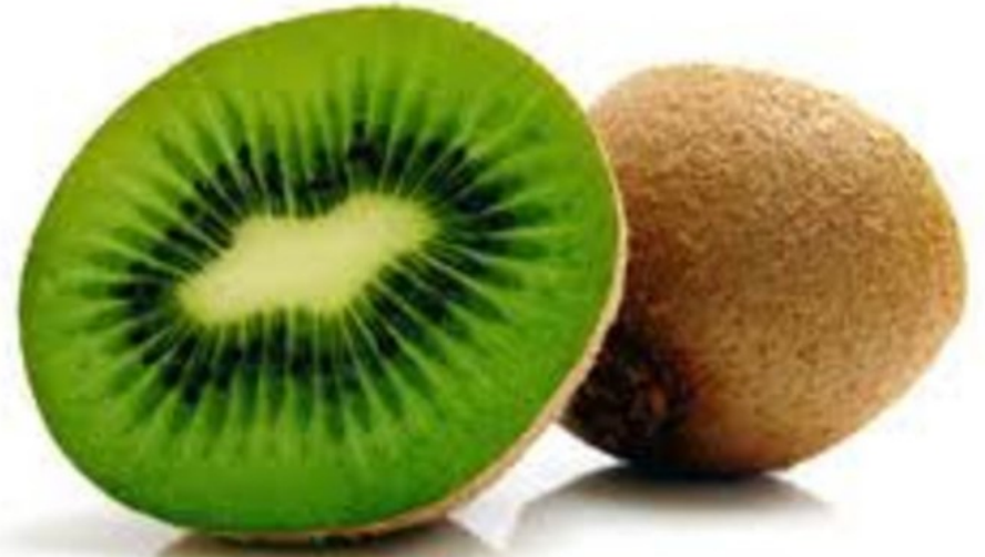
KIWI kiwi kiwi