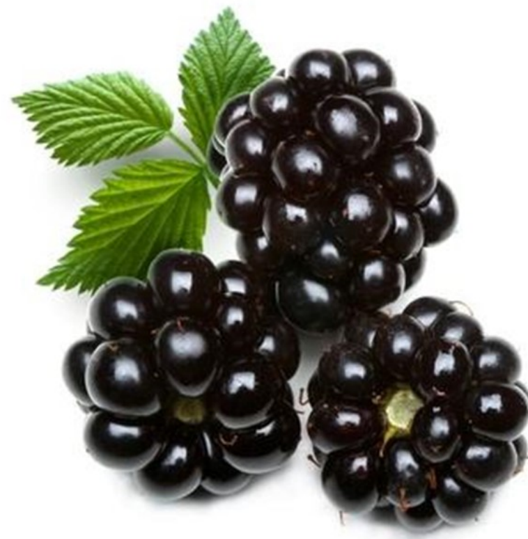
MURE mûre mûre