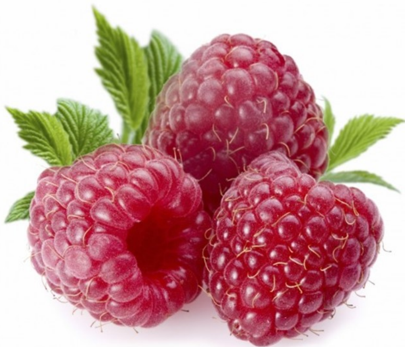
FRAMBOISE framboise framboise