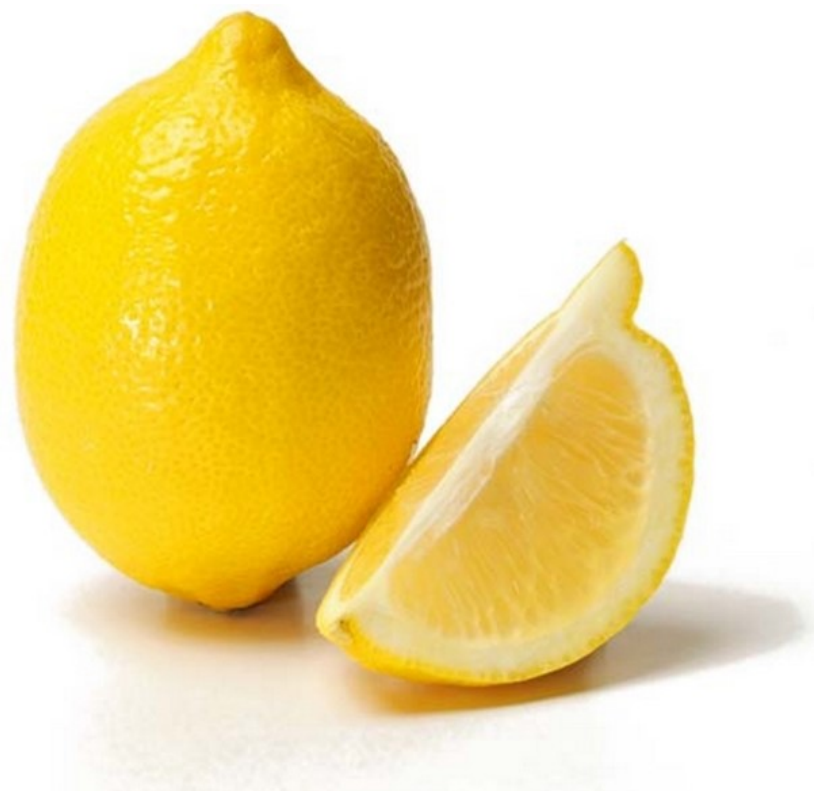
CITRON citron citron