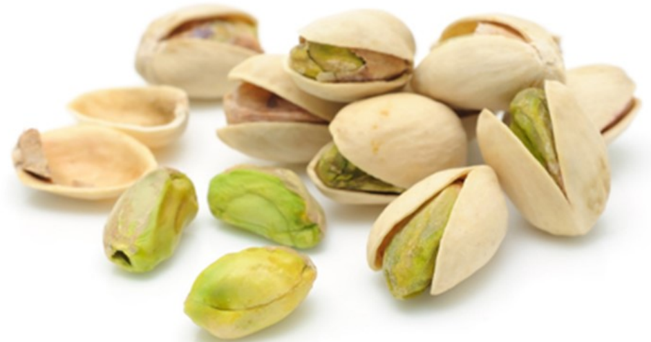
PISTACHE pistache pistache