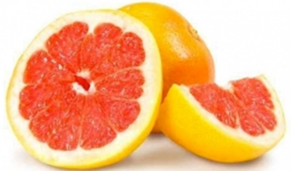
PAMPLEMOUSSE pamplemousse pamplemousse