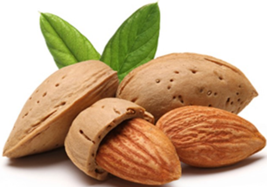
AMANDE amande amande