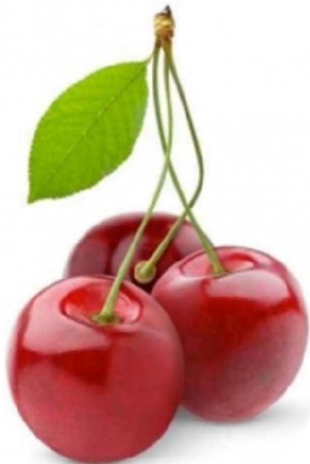
CERISE cerise cerise