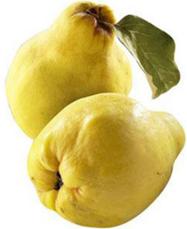
COING coing coing