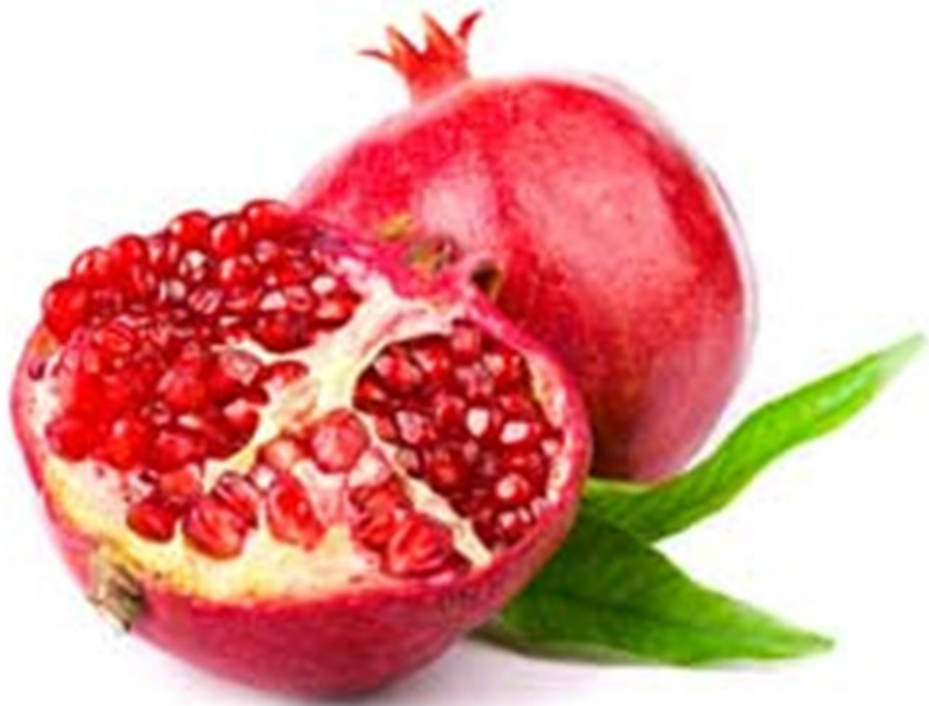
GRENADE grenade grenade