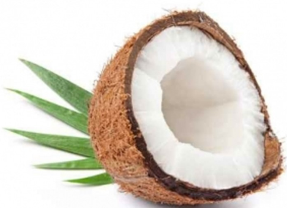
NOIX DE COCO noix de coco noisc de coco