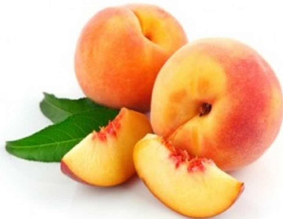
PECHE pêche pêche