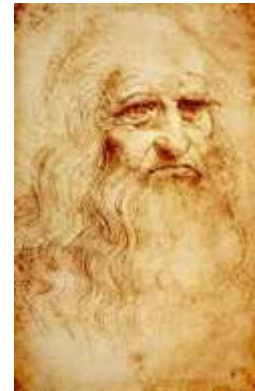
Léonard de Vinci

Pour faire plus connaissance avec Léonard de Vinci, tu peux regarder la vidéo : https://www.lumni.fr/video/c-est-qui-leonard-de-vinci