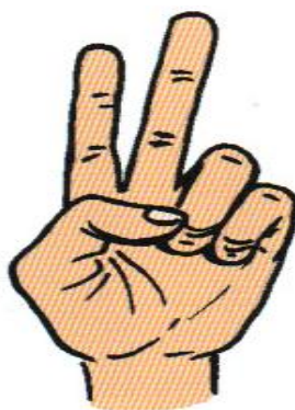
Avec l'index et le majeur

Et avec 2 mains : comment peut-on voir 2 doigts en tout (un et un)?