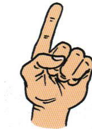
1 avec l'index