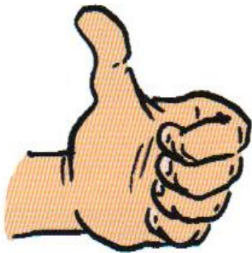
1 avec le pouce