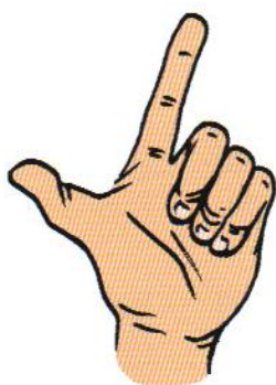
Avec le pouce et l'index

Solutions : Montrez avec vos doigts si l'enfant n'arrive vraiment pas.