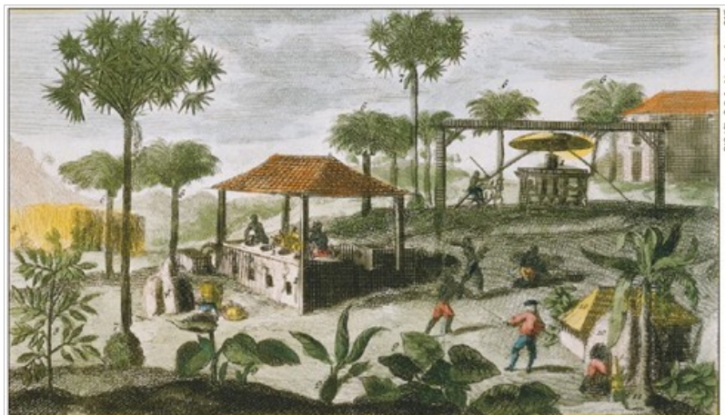
Une sucrerie aux Antilles, gravure de S. Leclerc pour l'Histoire des Antilles du Père Dutertre, XVII e siècle

Quel produit agricole est cultivé ici ? Pour qui ?