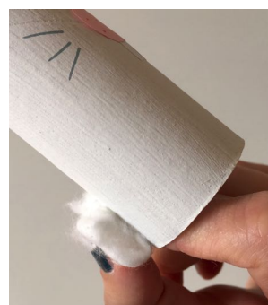
Puis coller-le derrière le rouleau