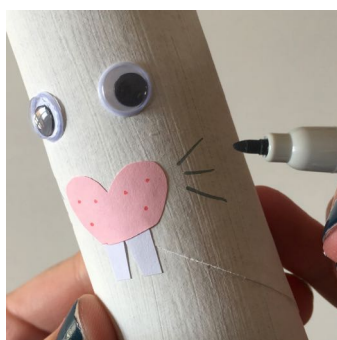
Puis des moustaches en gris