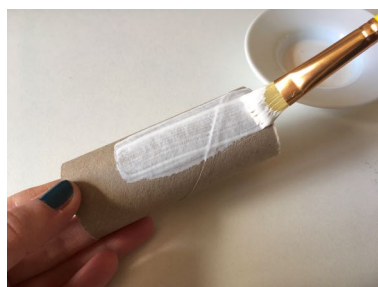
Peindre le rouleau de papier toilette