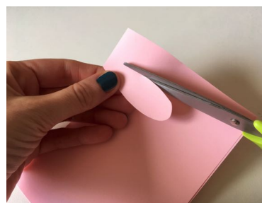
Découper des oreilles roses