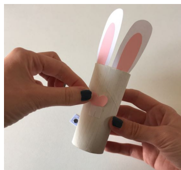
Le nez et les dents