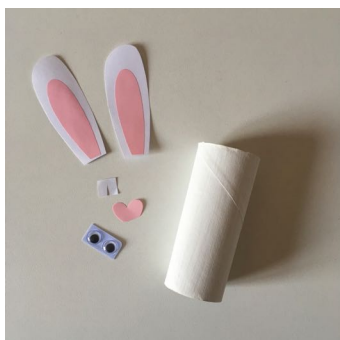
Puis coller les éléments sur le rouleau: