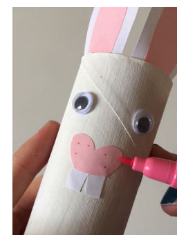
Tracez des points sur le nez