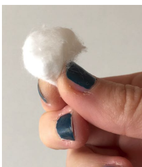
Prendre un coton et tenez-le en boule