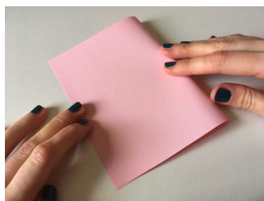
Plier le papier rose en deux