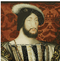
François 1 er