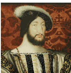
François 1 er