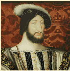
François 1 er 1515-1547