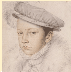
François II 1559-1560