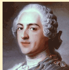
Louis XV 1715-1774