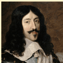
Louis XIII 1610-1643