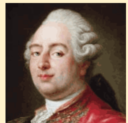
Louis XVI 1774-1792

Aux XVI ème et XVII ème Siècle , Le pouvoir royal est à plusieurs reprises menacé et affaibli . Durant les guerres de religion et au début du règne de Louis XIII et Louis XIV trop jeunes pour régner et dont la régence fut assurée par les reines mères et leurs ministres. Mais, malgré les difficultés, le pouvoir royal l'emporte. Henri IV réussit à rétablir la paix civile et conforte l'autorité royale. Louis XIII conseillé par son premier ministre Richelieu , établit une paix durable entre protestants et catholiques. Mazarin, le premier ministre de Louis XIV au début de son règne réussit à vaincre la révolte des nobles : la Fronde et renforce l'autorité royale.