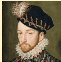
Charles IX 1560-1574