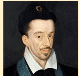
Henri III 1574-1589