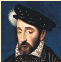
Henri II 1547-1559