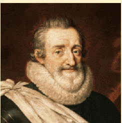
Henri IV 1589-1610