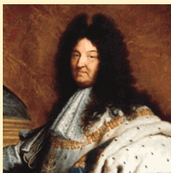
Louis XIV 1643-1715