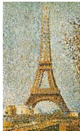
La tour Eiffel