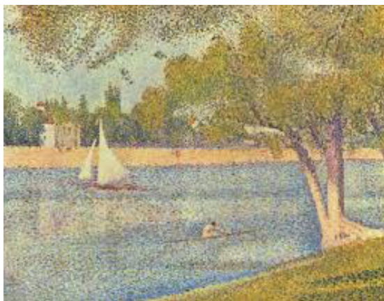
La seine de grande Jatte