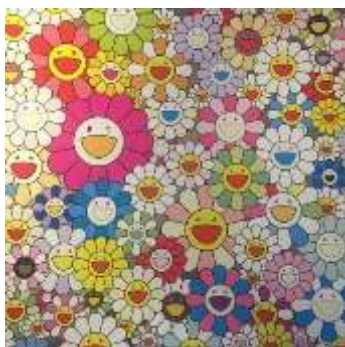
Field of smiling flowers, 2010