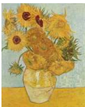
Vase avec douze tournesols 1888

Vincent Van Gogh (1853 1890) n'a pas eu une vie très heureuse car il n'a pas eu du succès durant sa vie mais aujourd'hui il est l'un des plus grands. Il a créé plus de 2000 toiles et dessins.