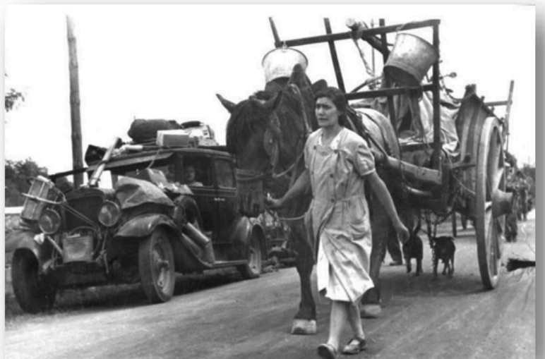
L'exode de 1940

La France est occupée sur la moitié Nord de son territoire et doit payer les frais d'entretien de l'armée allemande.