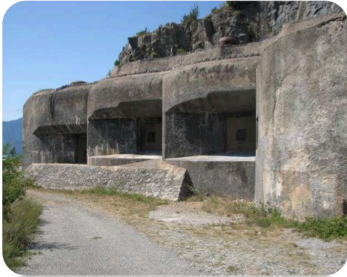
Blocs de la ligne Maginot

Après l'invasion de la Pologne, la guerre se déroule sans combat de septembre 1939 à mai 1940.