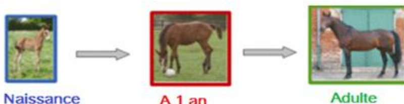
Stade de développement d'un cheval après sa naissance

Que s'est-il passé dans l'utérus de la jument ?