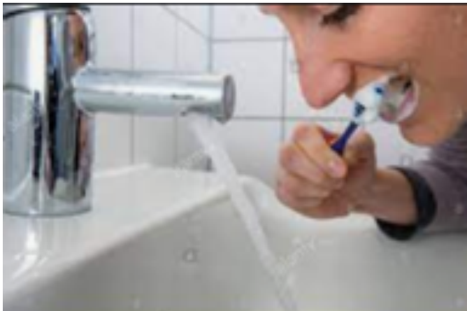
SE BROSSER LES DENTS