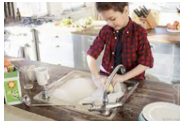
FAIRE LA VAISSEILLE