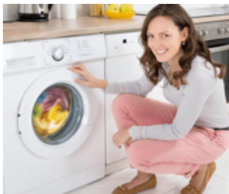
LAVER LE LINGE